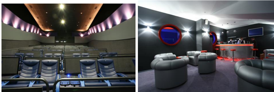
Концепция залов Relax в сети «Синема Парк» (Новосибирск)

Еще одна возможность привлечения зрителя в условиях возрастающей конкуренции – оборудование залов повышенной комфортности. VIP-залы в российских кинотеатрах становятся все более изысканными; развиваются концепции целых кинотеатров премиум-класса; крупные киносети выделяют это направление в качестве стратегического и планируют оснащать все свои комплексы отдельными залами с прилегающей территорией только для VIP-клиентов – например, проект сети «Синема Парк» по оборудованию в своих новых мультиплексах залов и зон Relax.